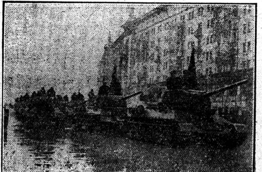
A szovjet páncélosok díszfelvonulása az egyik Moszkvában lezajlott katonai díszszemle alkalmából.