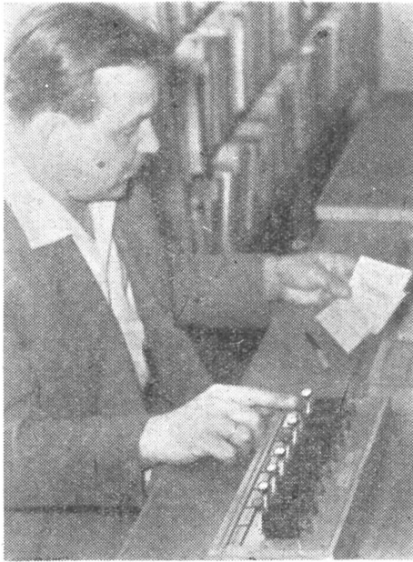
A statisztikai számláló szerkezet működés közben

lenne szükség, mivel a számláló akár egy hónap forgalmi adatait is regisztrálhatja.)