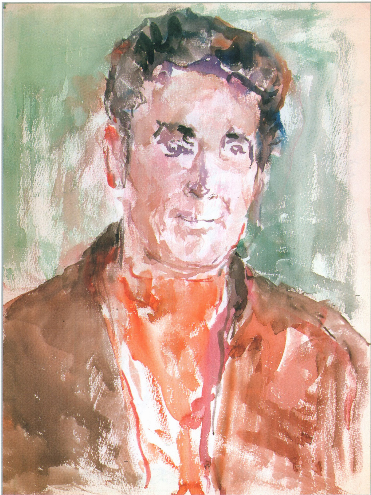
Férfi barna kabátban