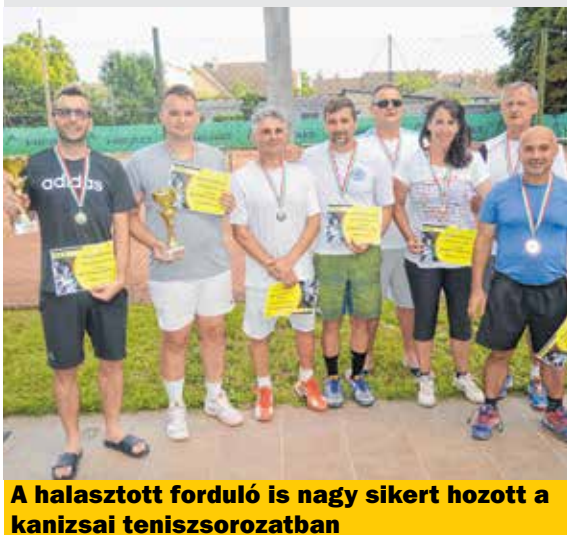
A halasztott forduló is nagy sikert hozott a kanizsai teniszsorozatban