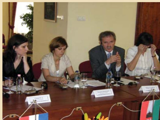
Kamarai hírek - 6. oldal.