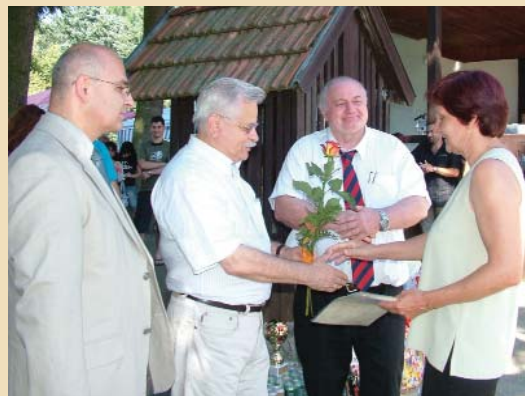
Semmelweis nap - 11. oldal.