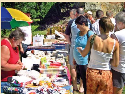
Magyar áru heti rendszerességgel - 2. oldal.