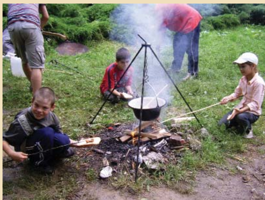
Segíts, hogy segíthessünk! - 5. oldal.