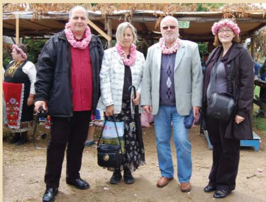
Kazanlakban jártunk - 9. oldal.