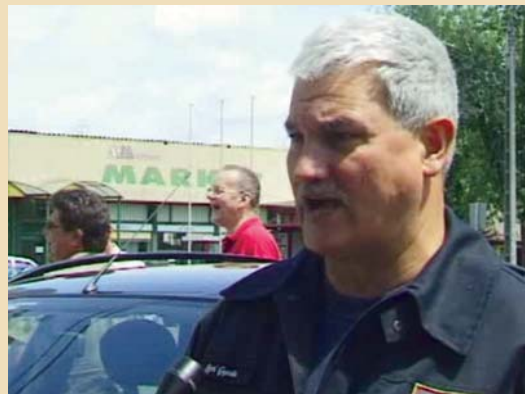
Neveltséges jégkár? - jegyzetünk a lap 2. oldalán olvasható.