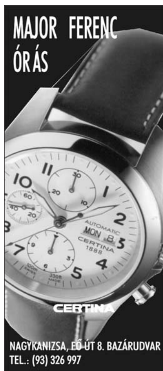
NAGYKANIZSA, ÉD-ÚT 8. BAZÁRUDVAR TEL.: (93) 326 997