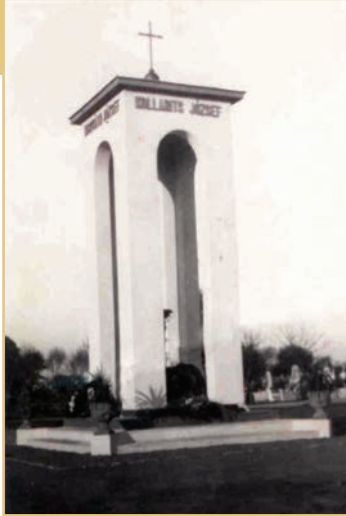
Az egyetlen fellelhető fotó az egykori emlékműről. Ezúton kérjük, akinek birtokában bármilyen más adat, fotó, dokumentum van a bakónaki mártírokról, juttassa el a szerzőnek.

lemlítsék, a fegyvereket beszolgáltassák. A Kardos-féle csoport Nagybakónak községbeli tevékenysége során fegyveres ellenállásba ütközött. A történeteket Kardos jelentette dr. Szabadosnak, valamint azt is, hogy az éjszaka folyamán féltek a községben maradni, ezért visszatértek Nagykanizsára. Dr. Szabados Vántus Károly budapesti népbiztostól segítséget kért a „nagybakónaki események elfojtására”. 1919. május 24-én reggel Sopronból egy kb. 160 főből álló különítmény indult el Entzbruder Dezső vezetésével. Ehhez a csapathoz Szombathelyen további 100 fő csatlakozott.