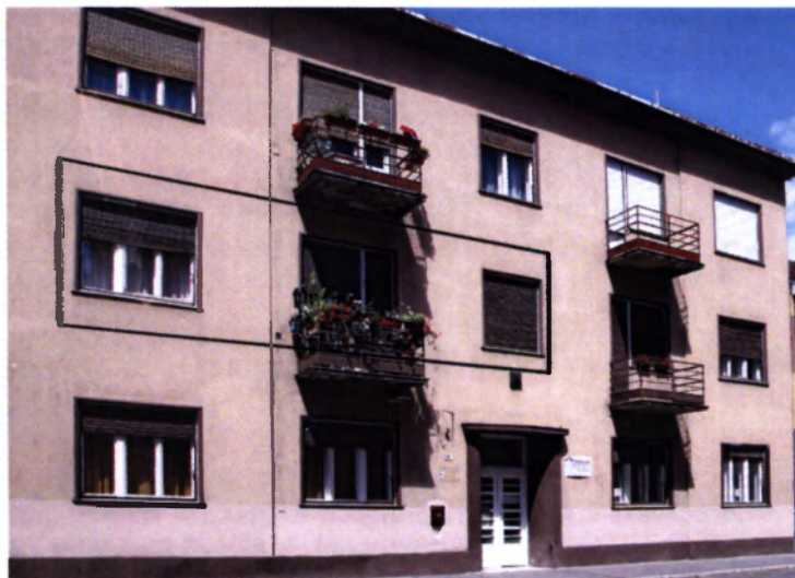
A Sugár út 16/a sz. alatti saját tervezésű és kivitelezésű ház (1934)