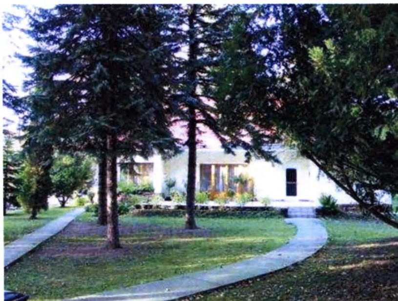
MAORT telepi mérnöklakás

A megbízhatóságnak és a számos megrendelésnek köszönhetően a Kalmár Zoltán cégnél a 40-es évek első felében közel 400 fő dolgozott, így ezáltal a Batthyányi grófok után, a város második legnagyobb adófizetője lett.