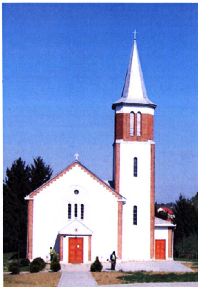
Csurgói evangélikus templom (1934)

Dunántúl-szerte kiváló alkotások (közutak, templomok) hirdetik szakmai hozzáértését és megbízhatóságát. Az ő tervei alapján épült fel Csurgón az evangélikus templom és paplak együttese, valamint Szerecsenyben az evangélikus templom terve szintén Kalmár Zoltán műve, melynek 60 éves fennállását éppen 2010-ben ünnepelte a helyi evangélikus közösség.