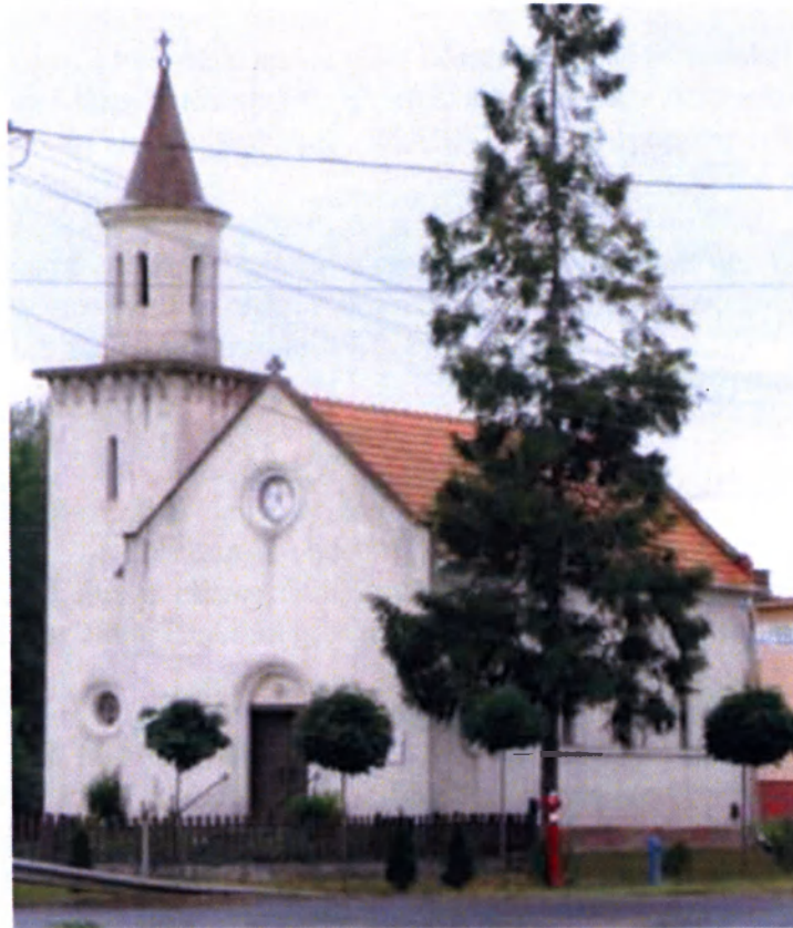
Evangélikus templom Szerecsenyben (1949)

Az országos evangélikus egyház támogatójaként a gyenesdiási „Kapernaum” felépítését nagyvonalú kivitelezői, illetve térítésmentes építőanyag szállítással segítette.