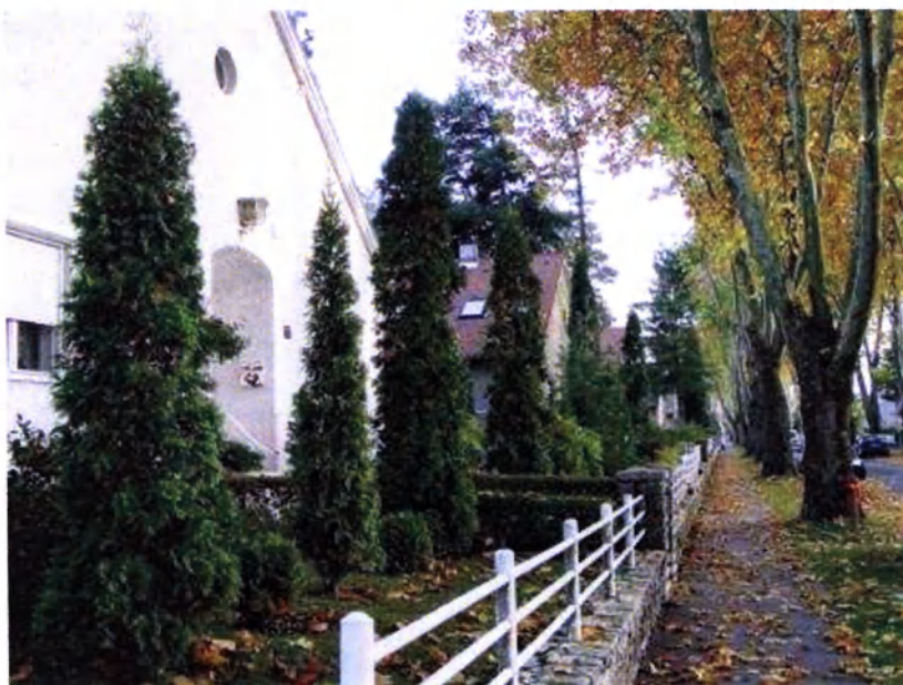
MAORT telepi vezető tisztviselői házak