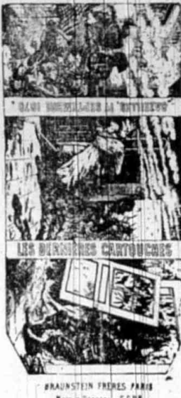
BRAUNSTEIN FRERES PARIS Marque Deposee 5628

saját czege alatt Bécsben, II. ker. Negerlegasse 8. sz. a. raktárt nyitott, továbbá kapható minden nagyobb ilyenmü czikket áru- 50 —50 sitó kereskedőknél.