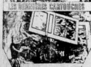
BRAUNSTEIN FRERES PARIS Marque déposée S.G.D.A.

Ezen minden cigarettázóra nézve nagyon fontos kérdés már a kétségtelenebb módon bebizonyult.