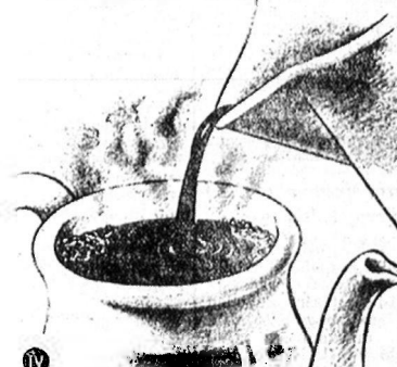
A főzetet szűrjük le kávéskannába.