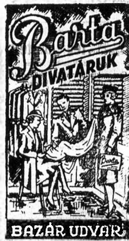
BARTA DIVATÁRÚK BAZÁR UDVARJ Telefon 8-476 Legszébbet = legolcsóbban!