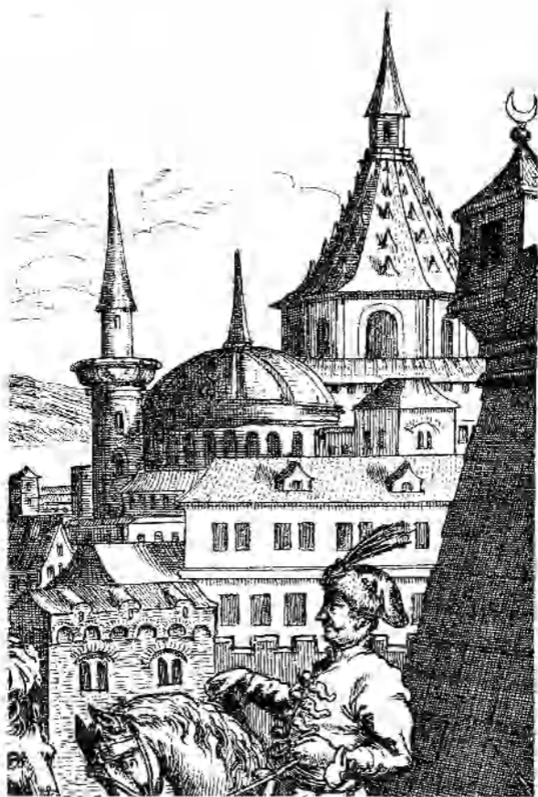
A volt szent Péter egyház (török dsámiává alakítva.)