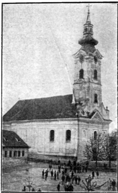
A jelenlegi Szent János egyház.